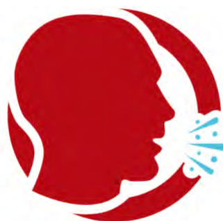
TOS / TOS