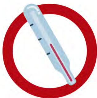
FEBRE / FIEBRE