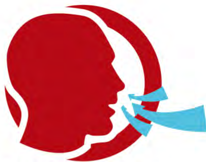
SENSACIÓ DE FALTA D'AIRE SENSACIÓN DE FALTA DE AIRE